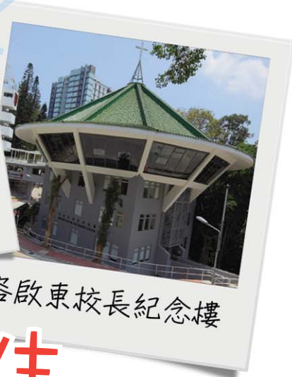
容啟東校長紀念樓